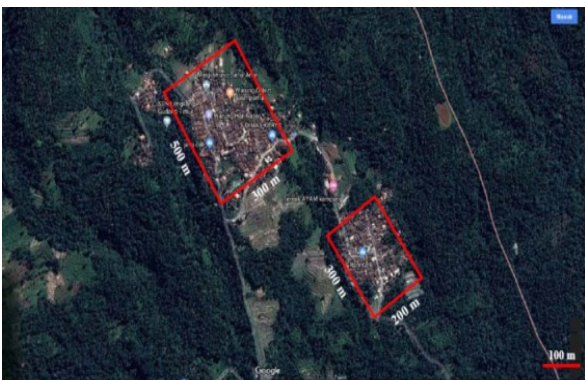
Gambar 4. Tiga perkampungan di wilayah kecamatan Majasari. Kampung Pasir Angin (kiri atas), Kampung Pagar Batu (kiri bawah) dan Kampung Paku Haji (kanan).

Lokasi penelitian adalah perkampungan dekat hutan di kaki Gunung Karang (Gambar 3). Wilayah sekitar puncak Gunung Karang masih tersisa hutan primer dataran tinggi; ketinggian Gunung Karang sendiri mencapai 1778 meter dpl ( http://www.kelair.bppt.go.id/sitpapdg/profilkabpdg.htm ). Ketinggian perkampungan-perkampungan lokasi survei terletak antara 400-800 meter dpl. Wilayah yang dikunjungi terdiri dari tiga kecamatan, yaitu Kecamatan Majasari yang terdiri dari tiga kampung (Kampung Pasir Angin, Kampung Pagar Batu dan Kampung Paku Haji); ketinggian tempat antara 430-600 meter dpl; Kecamatan Karang Tanjung yang terdiri dari tiga kampung (Kampung Cinyurup, Kampung Domba dan Kampung Soreah); ketinggian tempat antara 450-560 meter dpl; dan Kecamatan Cadasari yang terdiri dari dua kampung (Kampung Keduangang dan Kampung Pasir Peuteuy); ketinggian tempat antara 590-740 meter dpl. Total jumlah rumah penduduk (tidak termasuk pondok villa, pondok di kebun dan gudang) di tiga kecamatan dan delapan kampung adalah sekitar 1100 rumah, yang mana informasi jumlah rumah di setiap kampung yang dikunjungi tidak pernah pada angka pasti, selalu merupakan angka “berkisar”, “kira-kira” atau “lebih kurang”.