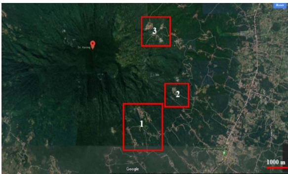
Gambar 3. Lokasi tiga kecamatan tempat dilakukan penelitian populasi Tokek Rumah di Kabupaten Pandeglang. (1) Kecamatan Majasari; (2) Kecamatan Karang Tanjung; (3) Kecamatan Cadasari.

manusia. Oleh sebab itu survei dilakukan melalui metode close questioner system (Gambar 2) yang dilakukan pada perumahan-perumahan yang terdapat pada suatu perkampungan.