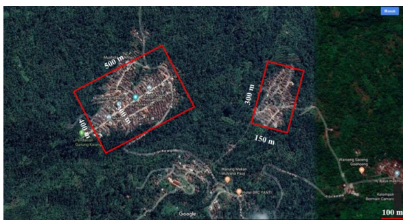
Gambar 6. Dua perkampungan di wilayah kecamatan Cadasari. Desa Keduengang (kiri) dan Kampung Pasir Peuteuy (kanan).

Desa Kaduengang adalah pemukiman padat yang letaknya paling tinggi di Kecamatan Cadasari dengan relief tanah pemukiman yang menurun cukup tajam. Desa ini paling dekat dengan lereng Gunung Karang. Habitat di sekitar desa didominasi oleh kebun tanaman keras berkayu, yaitu pohon petai, pohon mahoni dan pohon damar. Cuaca sewaktu survei langit cerah; survei malam hari langit cerah. Jumlah rumah yang dikunjungi 79 rumah; terdiri dari rumah semi-permanen sebanyak 6 rumah, rumah kayu sebanyak 7 rumah dan rumah gedek sebanyak 7 rumah. Rumah yang terdapat Tokek rumah sebanyak 41 rumah yang semuanya rumah tipe permanen, dengan jumlah individu tokek rumah hasil wawancara sebanyak 45 individu. Respon penghuni rumah untuk keberadaan tokek rumah di kediamannya sebagai pembawa rejeki sebanyak 5 responden, sebagai bahan obat sebanyak 1 responden, suka dengan suara tokek rumah sebanyak 1 responden. Jumlah