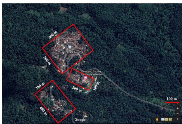
Gambar 5. Tiga perkampungan di wilayah kecamatan Karang Tanjung. Kampung Cinyurup (atas), Kampung Domba (tengah) dan Kampung Soreah (bawah).

Perkiraan luas wilayah tiga perkampungan yang disurvei berdasarkan peta Gambar 5 adalah sebagai berikut: Kampung Cinyurup seluas 12 hektar ( 300 \times 400 \text{ m} = 120,000 \text{ m}^2 = 12 \text{ ha} ); Kampung Domba seluas 2 hektar ( 100 \times