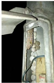
Gambar 7. Tokek Rumah bersarang secara alami di lubang tiang listrik yang dijumpai di salah satu penginapan di kota Pandeglang pada tanggal 28 Maret 2019.