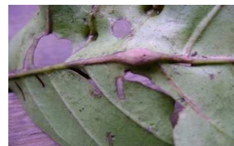
Gambar 4. Deskripsi dan foto nyali. ( Description and photograph of galls. )