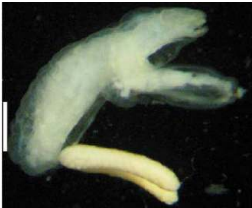
Gambar 2. Perbandingan morfologi pada A. Thysanote chalermwati dipertelakan oleh Piasecki et al. , 2008 dan B. Thysanote sp. ditemukan oleh Yuniar, et al. 2007. Garis skala: A. 0,5 mm; B. 1,5 \mu m (A; Piasecki et al. , 2008, B ; Yuniar et al. , 2007)