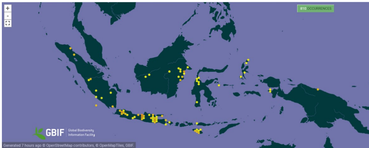
Gambar 1. Data keberadaan kupu-kupu berdasarkan foto kupu-kupu yang dikontribusikan oleh penggiat kupu-kupu yang ditampilkan di GBIF ( https://www.gbif.org/dataset/4d236e9c-fa04-4a94-9356-382c9f7c84c0 ) ( Data of butterfly occurrence based on butterfly photos contributed by butterfly enthusiasts as displayed on GBIF ( https://www.gbif.org/dataset/4d236e9c-fa04-4a94-9356-382c9f7c84c0 ))

Sebanyak 29 peserta lokakarya mengirimkan foto-foto kupu-kupu. Data foto yang telah diproses ini tercatat dari 146 lokasi yang berbeda di 21 provinsi di Indonesia. Pengambilan foto yang terkumpul ini mencakup kurun waktu mulai Mei 2009 hingga November 2021 (Tabel 1). Data occurrenceID yang ada pada Tabel 1 merupakan data yang ada di dalam kode QR yang telah di-