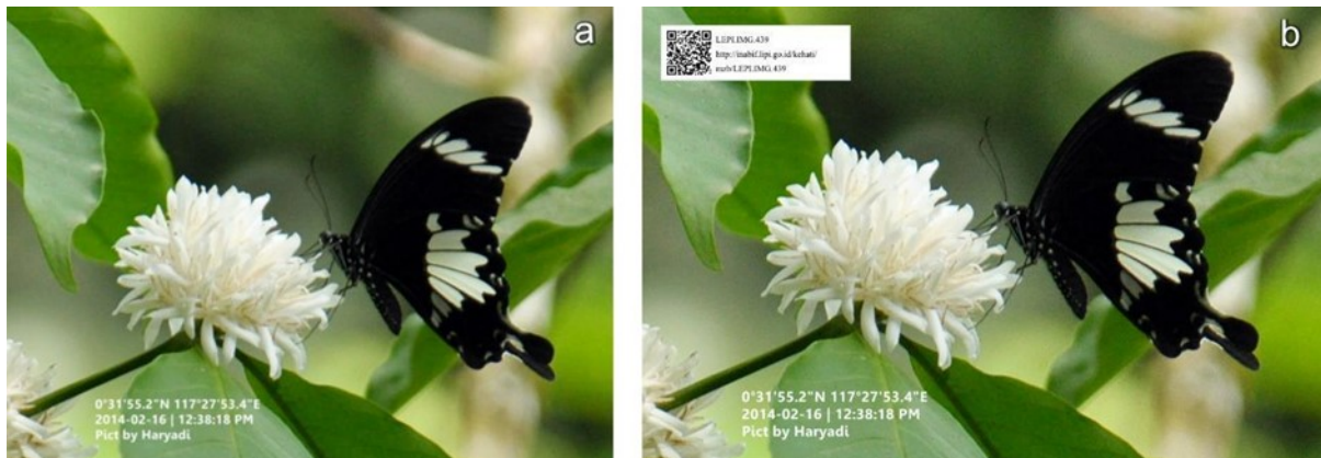
Gambar 3. Contoh foto yang dikirimkan oleh penggiat kupu-kupu: a. Foto asli oleh penggiat kupu-kupu, b. Foto yang telah diberi kode QR. ( An example of a photo sent by a butterfly enthusiast: a. Original photo by butterfly enthusiast, b. Photo that has been given a QR code. )