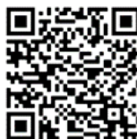
Gambar 5. Akses terhadap data ini pada link GBIF dapat diperoleh dengan scan kode QR ini. ( Access to this data on the GBIF link can be obtained by scanning this QR code. )

https://www.gbif.org/dataset/4d236e9c-fa04-4a94-9356-382c9f7c84c0